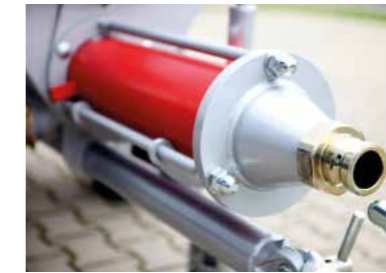
Red Fire Förderschnecke