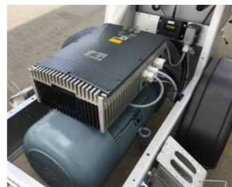
Der 22 kW Elektromotor

Die Vorteile auf einen Blick: Keine Wartung, keine Dieselskosten, keine Bremse, nur PKW-Führerschein zum Ziehen erforderlich. Leicht zu reinigen dank großer Reinigungsöffnung, Gitter schwenkbar und sehr stabil.