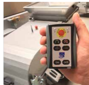
Mit praktischer Fernbedienung