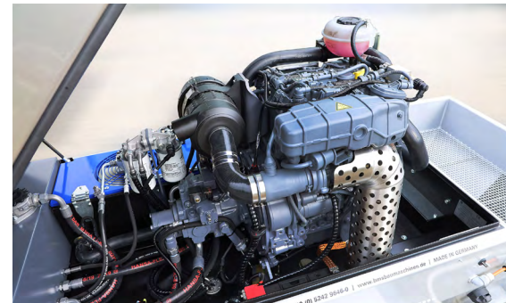
DEUTZ TD 2.2 Motor mit Hydraulik-Einheit

Das von BMS entwickelte und bewährte Hydrauliksystem wurde auch in dieser Maschine verbaut. Es ist robust und leistungsstark. Die Hydraulikpumpe wird direkt angesteuert und arbeitet besonders effizient. Die Fördergeschwindigkeit lässt sich stufenlos regulieren. Im Display werden alle relevanten Informationen angezeigt. Außerdem sorgt die zusätzlich eingebaute Rührwelle im Förderbehälter dafür, dass das Material immer in Bewegung ist. Damit ist sichergestellt, dass sich das Mischgut nicht absetzt. Die Anlage ist – wie alle alpha-Maschinen – mit dem bewährten BMS-Kühlsystem ausgestattet.