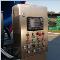
Danfoss-Steuerung der neuesten Generation.