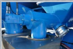
Mischbehälter über Gummiringe abgedichtet.

ALLE MODELLE SOWOHL ALS SATTELAUFLIEGER ALS AUCH MIT 4-ACHS-CHASSIS 8X4 ERHÄLTlich