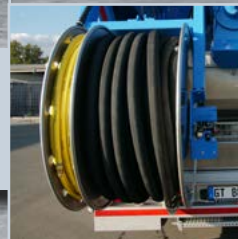
Schlauchabroller (hydraulisch) im Heck positioniert.