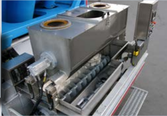
MISCHBEHÄLTER leicht zu reinigen.