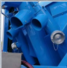
Wahlweise mit Förder- schnecke oder Förderband.