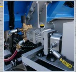
Im Leistungsumfang enthalten.