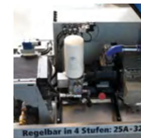
Die leistungsstarke Verdichereinheit