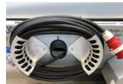
Kabelhalter zum einfachen Aufrollen des Zuleitungskabels.