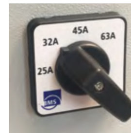
Leistung in 4 Stufen regelbar