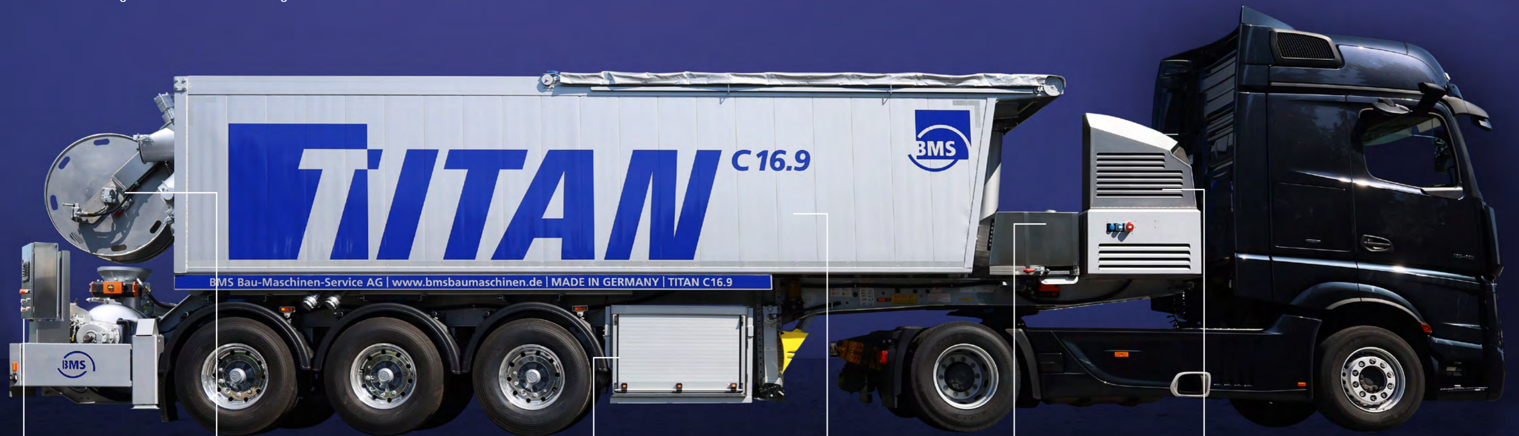
SCHALTSCHRANK MIT BEDIENERPULT

Alle Ausführungen sowohl als Sattelaufleger als auch mit 4-Achs-Chassis 8x4 erhältlich.