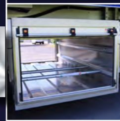
STAUFACH FÜR ZUBEHÖR

Das stabile Schiebe-verdeck ist elektrisch angetrieben, lässt sich zum Beladen leicht öffnen und schließen.