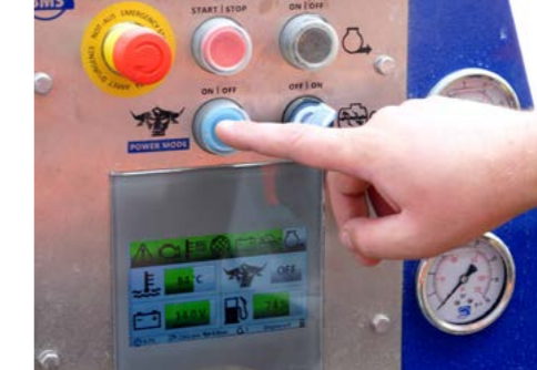
Auf Knopfdruck mehr Leistung. Serienmäßig mit Powerbull-Modus ausgestattet.