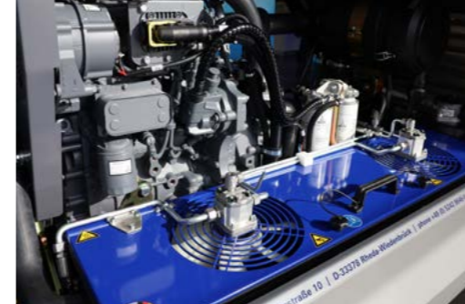
Das bewährte BMS-Kühlsystem – mehr Kühlleistung über zwei hydraulisch angetriebene Lüfter.