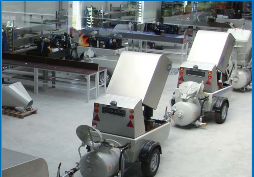
Blick in die Fertigungshalle von BMS

Es kommt auf Qualität, Zuverlässigkeit und Terminalsicherheit an, damit Aufträge zur absoluten Zufriedenheit des Kunden ausgeführt werden können!