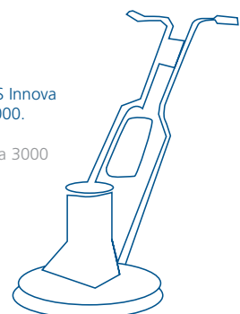
The machines BMS Innova 3000 and BMS Innova 4000.